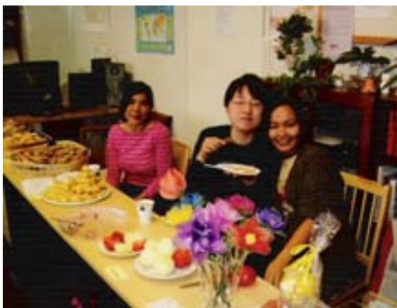
Kuva 13. Nyttikestit 18.5.2004 Porin Seudun kalevalaisten naisten kanssa.

Heti tammikuun loppupuolella yhdistyksessä vietettiin suurella joukolla venäläisen kulttuurin iltaa. Tilaisuudessa juhlittiin Pyhän Tatjanan päivää. Ohjelmassa oli muun muassa klassista musiikkia, runoja, kahvitarjoilu sekä erilaisia musiikki-esityksiä. Osallistujia juhlassa oli kaiken kaikkiaan 55 henkilöä.