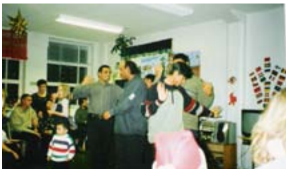
Kuva 7. Pikkujoulut. Tarjolla eri maiden ruokia sekä tanssia.

Kerran kuukaudessa yhdistyksessä järjestettiin ajankohtaan sopivia illanviettoja ja juhlia. Tilaisuudet olivat kaikille avoimia ja maksuttomia. Usein juhlissa oli myös maksuton tarjoilu. Vuonna 2001 juhlissa oli huomioitu kaikki jäsenet lapsesta vanhukseen. Tarjolla oli muun muassa nuorille disco, naisille hemmottelu- ja miehille peli-ilta.