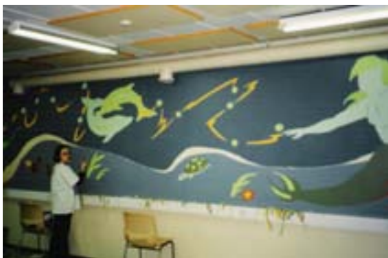
Kuva 6. Maija Viertola maalaa uusien tilojen seiniä.

Uudet tilat olivat paremmat edelliseen kellaritilaan verrattuna, mutta nekään eivät silti olleet puitteiltaan parhaat mahdolliset yhdistyksen toimintaa ajatellen. Puutteellisen ilmaston vuoksi erityisesti kesällä tiloissa työskentely on raskasta. Tilat ovat myös liian pienet yhdistyksen toimintaa ajatellen, sillä usein illanvietoissa ja muissa tilaisuuksissa osallistujien määrä on jopa 100 henkilöä, kun turvallisuusmääräykset sallisivat vain 70. Yhdistyksen vanhemmille jäsenille on vaikeuksia tulla tiloihin, sillä yläkertaan johtavat portaat ovat hyvin jyrkät ja vaaralliset.