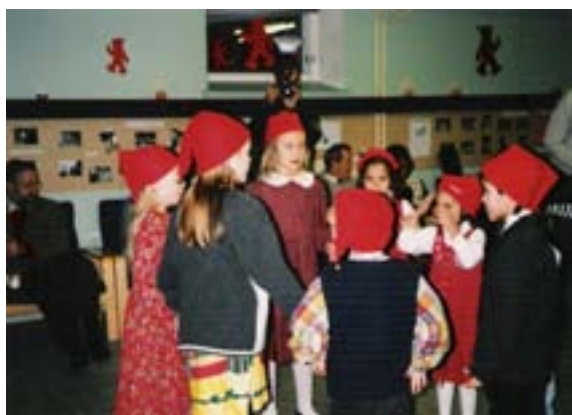
Kuva 2. Lapset esiintyvät pikkujouluissa.

Satakunnan Monikulttuuriyhdistys ry oli edustettuna monessa tapahtumassa, mutta ideoi paljon toimintaa myös itse. Mielenkiintoisia tapahtumia olivat esimerkiksi ”Unkarilaiset kevätillat”, ”Eri maiden pukuja” –näyttely sekä luontoretki Nakkilan Pinkjärvelle, joka oli tarkoitettu jäsenille. Yhdistys järjesti myös erilaisia iltoja, esimerkiksi ”Marokkolainen ilta”, yhteislaulu-ilta, pikkujoulu ja ystävänpäivä.