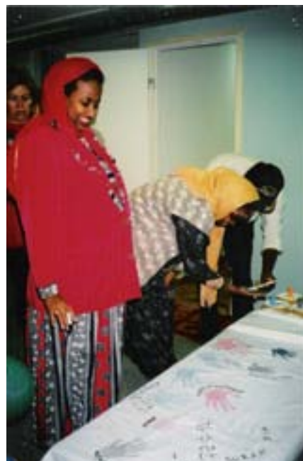
Kuva 1. Tilojen avajaiset.

Tilan avajaiset pidettiin 11.10.1996. Avajaisissa päätettiin, että tiloja kutsutaan International Meeting Point:ksi. Tämä monikulttuurinen toimintakeskus on avoinna kaikille ikään, kansalaisuuteen, uskontoon ja ihonväriin katsomatta. Avajaisissa kävi noin 60 vierasta tutustumassa yhdistyksen uusiin tiloihin, osa vieraista jätti kädenjälkensä muistoksi vieraskirjana toimineeseen lakanaan. Avajaisten jälkeen Satakunnan Monikulttuuriyhdistys ry:n toimistoa pyöritettiin vapaaehtoisten avulla.