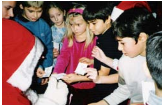
Kuva 10. Vuoden 2002 vappujuhla ja pikkujoulut.