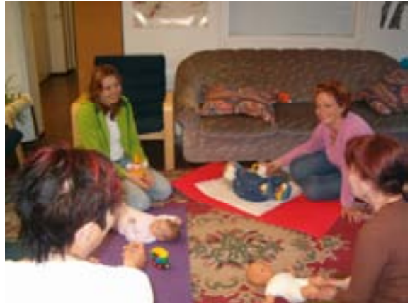
Kuva 19. Vauvahierontaa äiti/isä-lapsi-kerhossa.

Kielikursseja oli edelleen monia, mutta osallistujia kursseilla kävi viikoittain vain muutamia. Uutena kerhona käynnistettiin vuoden 2005 keväällä monikulttuurinen äiti/isä-lapsi-kerho. Kerhoon osallistui 3- 5 äitiä sekä heidän lapsensa.