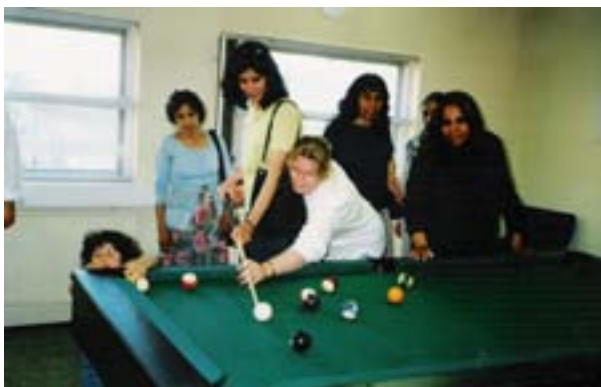
Kuva 5. Naiset testaavat biljardipöytää uusissa tiloissa.