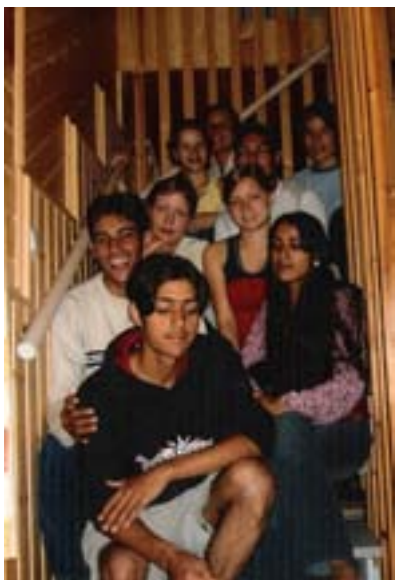
Kuva 11. Mökkileirille osallistuneita nuoria.

NYT-projektin toiminta laajeni vuoden 2002 jälkeen niin, että jokaviikkoisten harrastustoimintoihin tutustumisen lisäksi maaliskuussa 2003 avattiin vain nuorille tarkoitettu International Café Internet (ICI). Tämä kahvila oli avoinna perjantaisin klo18–22. Nettikahvilassa nuorille tarjottiin mahdollisuus pelata biljardia ja pingistä, kuunnella musiikkia, käydä internetissä, tehdä pientä purtavaa sekä tavata muita nuoria. Vetäjän ohella kahvilassa valvojina toimivat vapaaehtoiset nuoret sekä työharjoittelijat. Vuoden aikana nuoret löysivät pikkuhiljaa kahvilan ja kävijöiden määrä kasvoi erityisesti loppuvuodesta. Nuorten toimintaan lähti mukaan myös paljon uusia nuoria sekä uusia vapaaehtoisia nettikahvilanvalvojiksi.