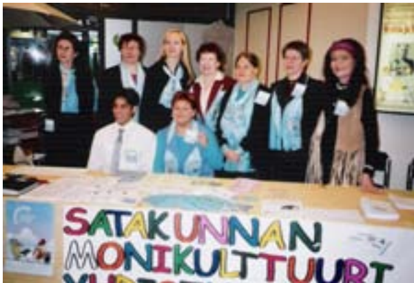
Kuva 15. Yhdistyksen edustajat Valkoisessa variksessa.